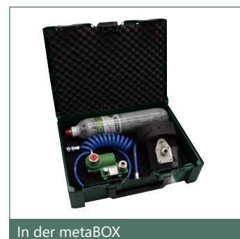
In der metaBOX

PKT-ADAPTER 400, Druckluftkartusche KT-3500, Spiralschlauch, Tragegürtel, in der metaBOX